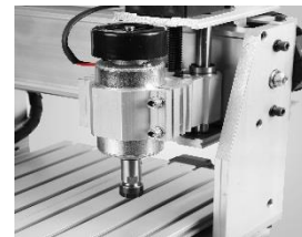
Spindle (husillo) 800W 1HP

Potente Husillo (Spindle) para Mini CNC serie 300.1 y serie 400 NCLUYE Tortillería y Base de aluminio