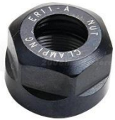
Tuerca para Boquilla ER-11

Tuerca para boquilla ER-11 compatible con boquillas ER-11 acepta boquillas desde 0.5 hasta 7mm y en estándar hasta 1/4